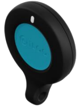
FOB utan knapp