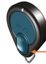
FOB med knapp