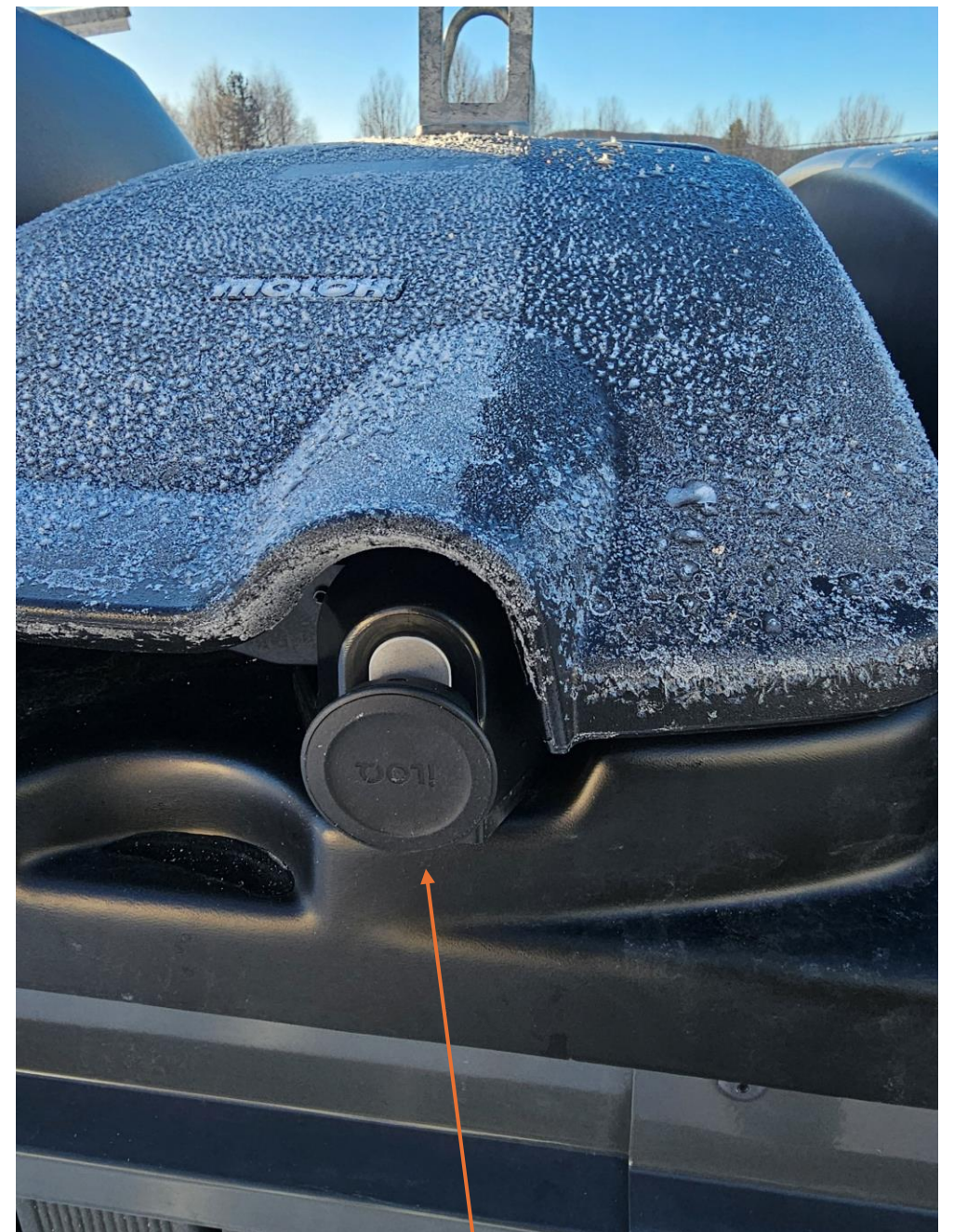
Låset på behållarna